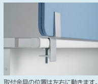
取付金具の位置は左右に動きます。